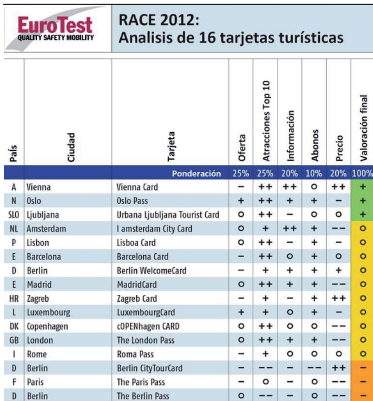
Tabla general de resultados del Análisis Europeo de tarjetas turísticas y su valoración por categorías: